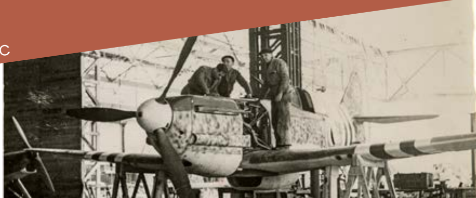
Une usine d'aviation près de Toulouse en 1944. Des ouvriers mettent la dernière main à un avion de chasse destiné aux forces françaises / Agence France Presse. ADHG, 24 Fi 1486.