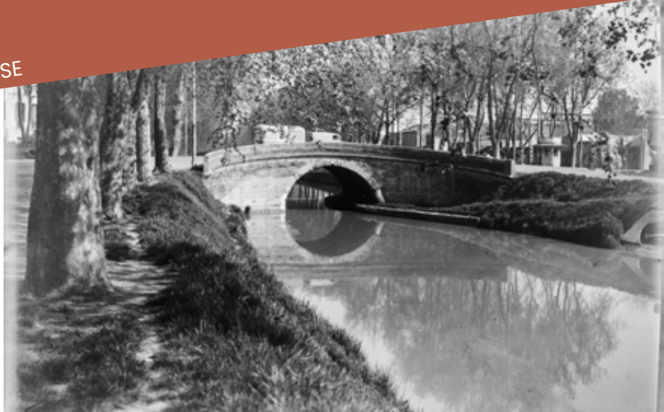
Le Pont des Demoiselles, après 1950.