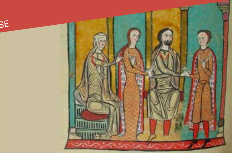
Liber feudorum major, cartulaire des comtes de Barcelone, fin XII e -début XIII e siècle. Cote : ACA, Cancillería, Registros, núm.1.