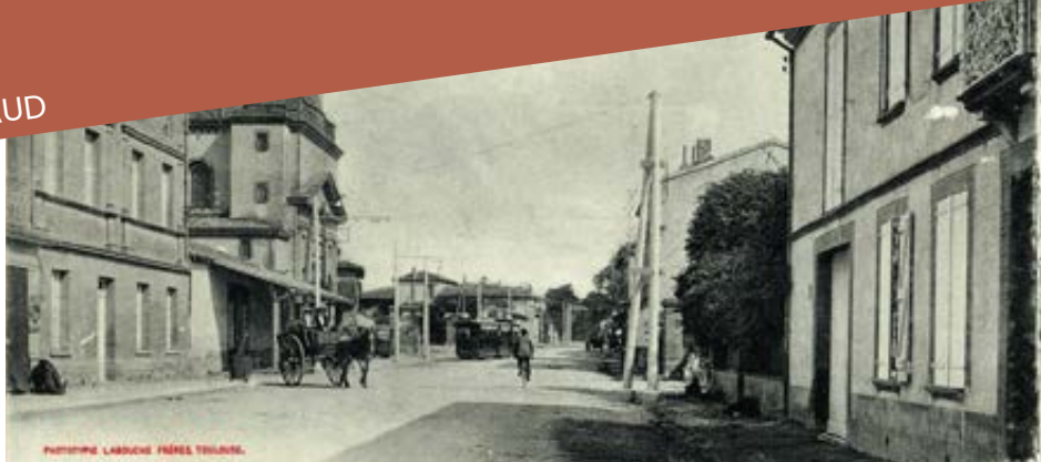
La Haute-Garonne. 165. Castanet : place de l'église et route nationale de Narbonne. Toulouse : phototypie Labouche frères, marque LF, [entre 1937 et 1950]. Carte postale. ADHG, 26 Fi 31 164.