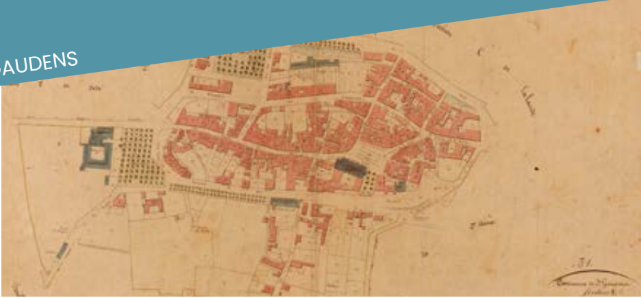
Plan du cadastre napoléonien de Saint-Gaudens. Section E de la Ville, 1 er feuille, éch. 1/1250. 1828. AHDG, 3 P 4425